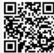
คู่มือการใช้งาน e-Voting

*หมายเหตุ การทำงานของระบบประชุมผ่านสื่ออิเล็กทรอนิกส์ และระบบ Inventech Connect ขึ้นอยู่กับระบบอินเทอร์เน็ตที่รองรับของผู้ถือหุ้นหรือผู้รับมอบฉันทะ รวมถึงอุปกรณ์ และ/หรือ โปรแกรมของอุปกรณ์ กรุณาใช้อุปกรณ์ และ/หรือโปรแกรมดังต่อไปนี้ในการใช้งานระบบ